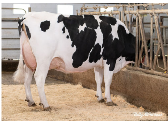
OCD LEGENDARY RAE FOURTH DAM